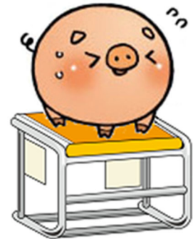
前橋市マスコットキャラクター“ころとん”

主 催 一般社団法人群馬県水泳連盟 ・ころとんプロジェクト委員会 主 管 一般社団法人群馬県水泳連盟 ・マスターズ委員会 公 認 一般社団法人 日本マスターズ水泳協会 後 援 前橋市、(公財)前橋観光コンベンション協会、前橋市水泳協会 公認番号 24-136 期 日 2024年12月14(土)～15(日) 会 場 しんしん大渡温水プール (公認25m×9レーン) 群馬県前橋市大渡町2-3-11